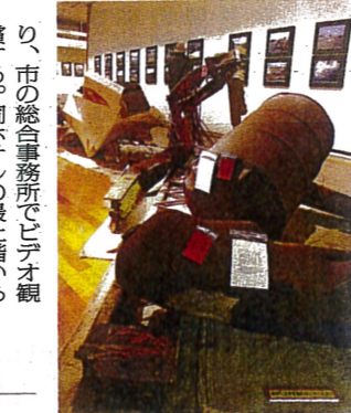
震災の記憶を伝える。撮影した津波の衝撃的映像で、ここでしか見られない。個人・団体を問わずガイド1件につき4000円の復興協力金を募っている。宮城県気仙沼市では、観光コンベンション協会が12年11月から「震災復興語り部」として実施。訪問客の予定に合わせて、1〜3時間のコースを組む。語り部は団体客のバスに乗り込む。時間3000円から。

4月から始めた「学ぶ防災」は、14年9月までに累計県内最多の約7万人が利用した。ガイドが案内するのは田老地区(旧田老町)。震災では高さ10m、総延長2.4kmに及ぶ大堤防を津波が越え、街全体を破壊し、死者は18人上った。ガイドが町全体を見晴らせる堤防の上で、震災の被害や教訓について説明。震災遺