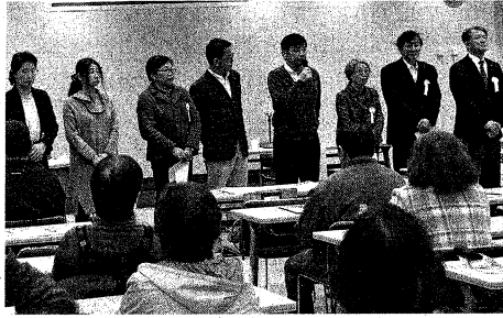
住民を前に自己紹介する新役員(24日、県石巻合同庁舎)

東日本大震災後に集団移転先として整備された石巻市新蛇田南地区で初めての自治会「あゆみの町内会」が24日、設立された。同地区では来月も二つの自治会が結成される予定で、地区全域がカバーされる。