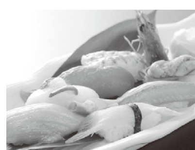
気仙沼 海の市 いちば寿司・リアスキッチン 営業時間11:00~21:00(ラストオーダー)