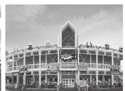
気仙沼 海の市 営業時間8:00~18:00 シャークミュージアム 開館時間9:00~17:00(不定休・要確認) 料金:中学生以上500円、小学生200円、未就学児無料