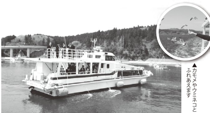
▲第三はまゆり 定員55名

ようやく昨年5月復活した志津川観光船「三陸復興国立公園」である湾内は、リアス式海岸特有の荒々しい岬や荒島野島竹島椿島(国の天然記念物)「椿島暖地性植物群落」に指定されている。ウミネコと戯れながら1時間ほどのクルージングが楽しめる。要予約、料金は大人1,100円、小学生550円、未就学児は無料。ホテル発10時15分(漁港岸壁発10時30分。団体割引(15名様以上有り)。