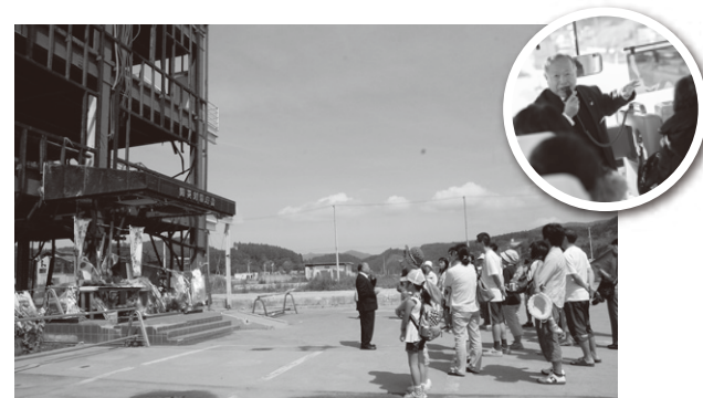
現地での語り部の様子

被災した私たちが、その体験をお伝えし、防災意識を高めるために役立てて頂くこと、「語り部バス」を運行しております。これまでに個人のお客様で7万人、団体のお客様を含めると20万人以上のお客様が乗車されました。当館をご利用のお客様限定で要予約、料金500円、所要時間1時間程度、朝8時45分出発です。団体様の場合は別途ご相談ください。